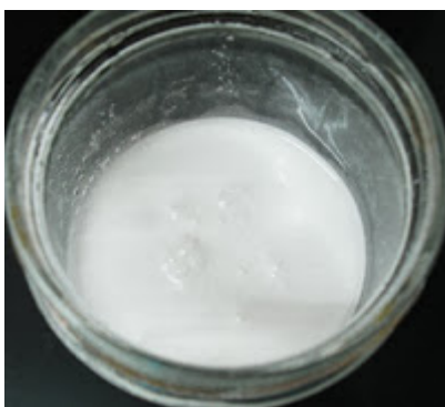
Mezcla de sosa caustica, agua y dióxido de titanio

Mide el agua en un vaso y la cantidad de sosa en otro vaso distinto. En este punto, recomendamos que te pongas gafas y mascarilla a la vez que abres la ventana para así evitar respirar los vapores.